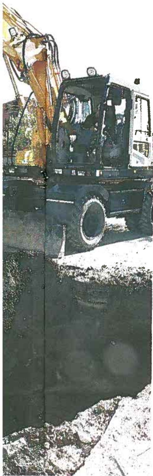
sättningar att bli en bra grävmaskinist. Att få ta ddschakt är personalen oerhört viktig.

Biljettsläpp den 19/5 Biljetter köps på huvudbiblioteket, hos Gestbloms bokhandel, Tant Bergs och Riksteaterföreningen - tfn 62 66 30, samt vid entrén en timme innan föreställningen börjar. Vår marknadsgata från förr öppnar samtidigt som biljettförsäljningen. 80 kr vuxna / 40 kr barn. 6/6 kl. 18.00 Premlid 7/6 kl. 15.00 och 18.00 8/6 kl. 16.00 Plats: Gröna, Rindhusgatan