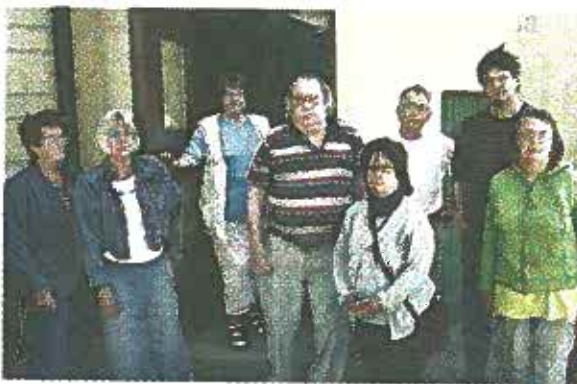
Bekymrade. Aktiva medlemmar och stödmedlemmar är oroliga för var RSMH Liljan ska hålla till i framtiden.