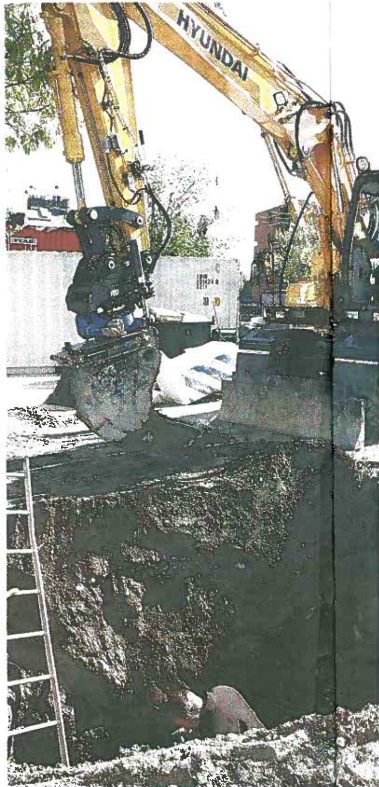
Gropman. Har man jobbat nere i gropen har man förutsättningar att bli en bra kompetent personal i branschen är svårt och för Addschakt är personalen